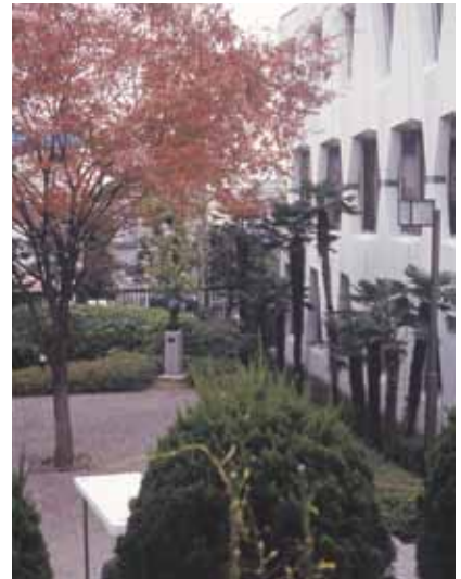
▲江古田キャンパス

えるくらいになってください。どんどんチャレンジして、どんどん失敗する、そしてその失敗から次につながるものをつかみ取る。失敗を糧にして、夢に向かって一歩一歩進んで行ってください」