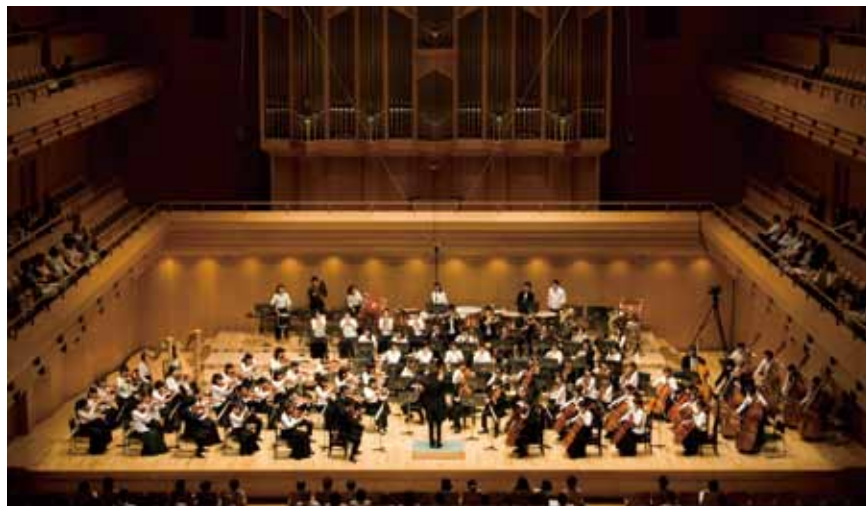
▲ 管弦楽団演奏会(東京オペラシティ コンサートホール)