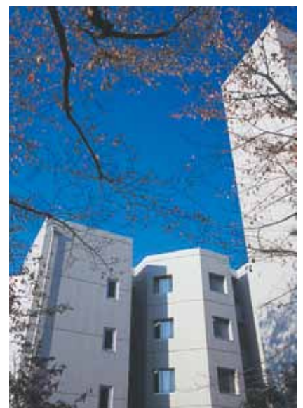
▲ 武蔵野音楽大学入間キャンパス

そもそも緊張やプレッシャーの捉え方が問題。時にプレッシャーは力になるし、ある程度の緊張は誰にとっても当たり前のことです。考えるべきは、それを前提にどうしたら結果が出せるかということ。そこで大切になってくるのは、日頃からどれだけプレッシャーを掛けた練習ができるか。練習に限らず、例えば文化祭等で積極的に人前に立つとか、あらゆるところで本番を想定した局面を体験するようにしたらどうでしょう。考え次第で、何でもないことでもメンタルを磨くチャンスになります。この他、既に皆さんやっていることでは、お守りを持つ、カツ丼を食べて験を担ぐなど、どんな小さなことでも自分のモチベーションをアップさせ、不安を解消することに役立つなら活用すると良い