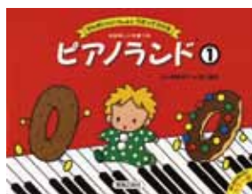
▲カラフルで楽しい教則本