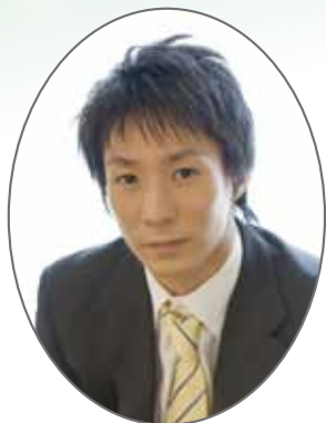
米田 功 Isao Yoneda

7歳から体操を始め、全国中学生大会で個人総合優勝。清風高校時代にインターハイで個人総合2位。順天堂大学に進み、1997年の全日本学生選手権個人総合2位、'98年のNHK杯で個人総合優勝。'99年には全日本学生選手権個人総合優勝、全日本選手権の鉄棒で優勝を果たす。シドニーオリンピックではまさかの代表落選。その雪辱を晴らし、2004年のアテネオリンピックでは日本男子体操のキャプテンとしてチームを牽引。団体で金メダルを獲得。種目別の鉄棒でも銅メダル獲得。その後、度重なる手術を乗り越えた'08年のNHK杯での演技は観る者に感動を与えた。惜しくも北京オリンピック代表の座は逃したが、金メダリストとしての経験をもとに、'09年からメンタルトレーナーとしての活動をスタート。'12年の米田功体操クラブ設立に向け準備を進めている。アイディアメンタルトレーニングセンター所属。