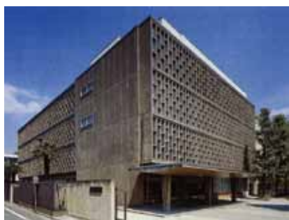
▲ベートーヴェンホール外観

1961年(昭和36年)10月7日、パイプオルガン披露式および記念演奏会の日を迎えました。式には、義宮殿下、秩父宮妃殿下を始め、各国大使、公使、音楽関係者、学園の教授、学生が列席。この日のためにはるばるドイツから来日した、巨匠ウィルヘルム・ケンプのパイプオルガン記念演奏