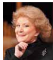
エレナ・オブラスツォワ Elena Obratsova (声楽/ロシア)

フランクフルト音楽大学に学び、P.サンカンに師事。マリア・カナルス及びヴィオッティ両国際コンクール第1位。国際シェーベルトコンクール音楽監督を始め数々の国際コンクールで審査員を務める。レコーディングも数多く、近年、シューマンの未公開「2台ピアノのための作品」「4手のためのピアノ作品」を初収録。現在、エッセン・フォルクヴァング音楽大学教授。