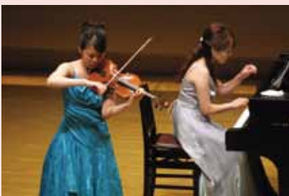
▲小林麻里(ヴァイオリン)