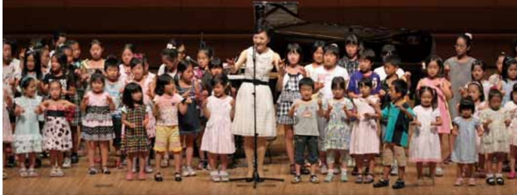
▲子どもたちと一緒にピアニスト体操

武蔵野を卒業してから、アニメソング、ゲーム音楽、コマーシャルなどの作詞・作曲、演奏、ジャズダンスのインストラクターまで様々なことに